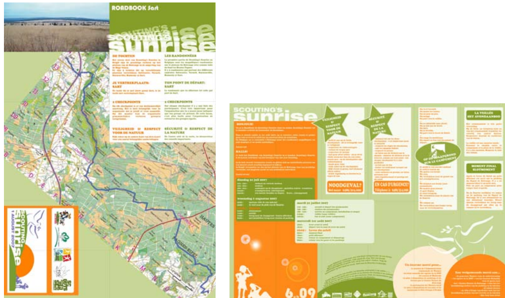
Un exemple de roadbook